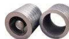
SC Silenziatore cilindrico con o senza ogiva, testato in conformità alla norma NF ISO 7235.