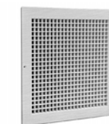
GAV 88 Griglia di ripresa in alluminio a maglia quadra.