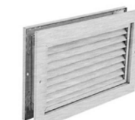
GAV 91 Griglia di transito in alluminio con alette fisse.