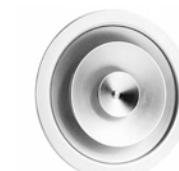
DAV 45 Diffusore circolare in alluminio a cono regolabili.