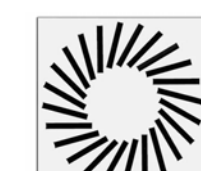
DFW Diffusore da soffitto per locali che necessitano di un comfort ottimale.