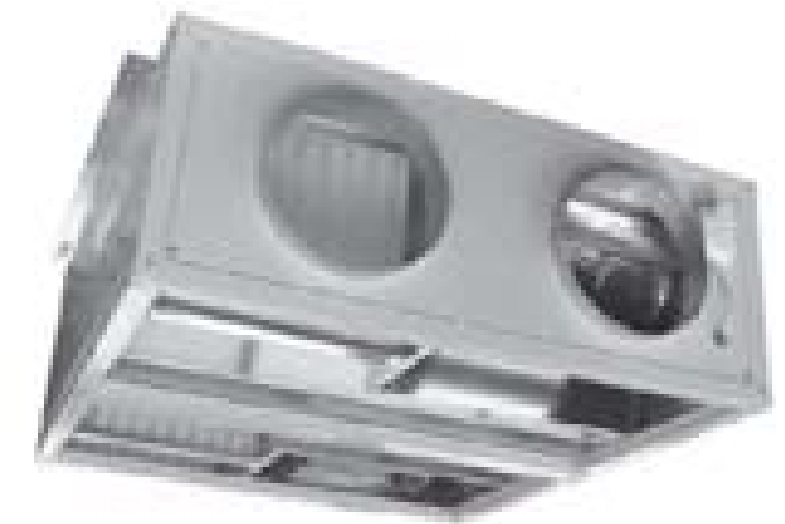
Recuperatore di calore statico a flussi incrociati, da 100 a 5600 mc/h.