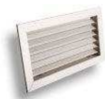
GLC 20A Griglia di ripresa in alluminio ad alette fisse con profilo anti pioggia.