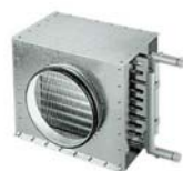
Batteria ad acqua calda