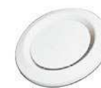
AUSTRALE Valvola di mandata e estrazione regolabile in plastica.