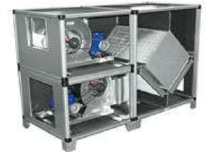
REC T- recuperatore di calore statico a flussi incrociati, fino a 8600 mc/h.